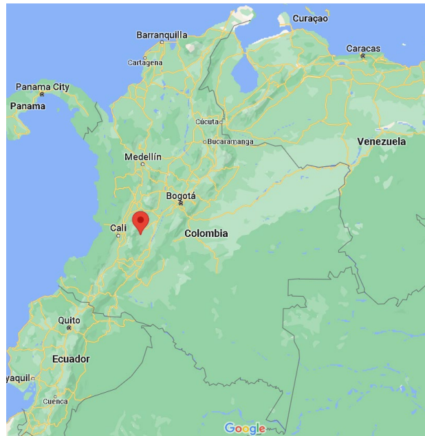
Ilustración 2. Localización de Rioblanco, Tolima